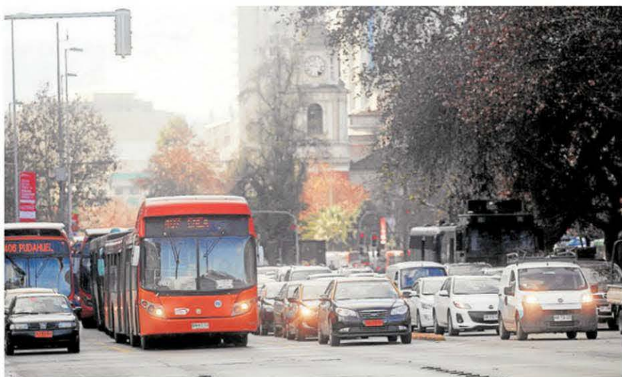
►► La esquina de Teatinos con la Alameda, el 14 de julio pasado.