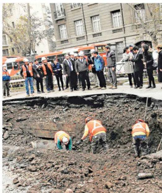
► Personal de la sanitaria trabaja para reparar la matriz.

No es todo: debido a los daños en el ducto también resultaron inundadas nueve estaciones de la Línea 1 de Metro (el tramo entre Los Héroes y Tobalaba), el eje más importante de la red que reúne a 400 mil pasajeros durante los horarios peak, los que viajan a diversos puntos de la ciudad. Así, los capitalinos tuvieron paralizado el servicio de Metro entre las 5.50 de la madrugada y hasta la noche, pues continuaban los trabajos para extraer el agua. Hoy se espera que se restablezca el servicio, aunque con una menor frecuencia de trenes por la mañana. También habrá un refuerzo con buses en las vías en su-