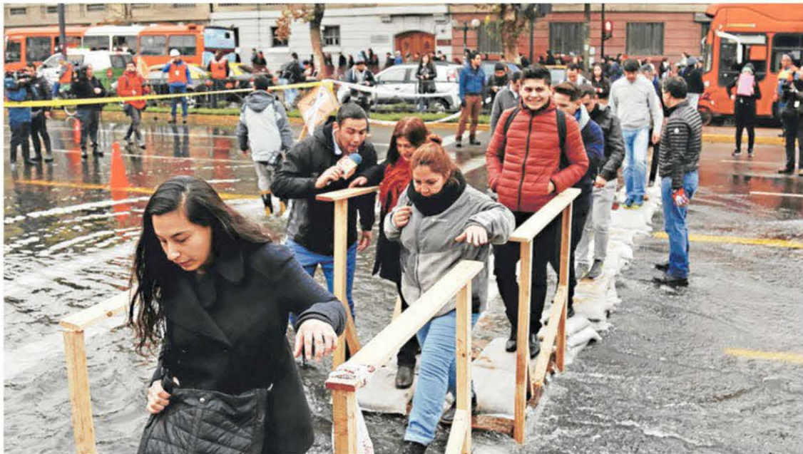
► Los transeúntes pudieron atravesar Providencia a través de una improvisada pasarela sobre el flujo de agua.

» Snapchat. La red de mensajería superó a Twitter en cantidad de usuarios activos, llegando a 150 millones de cuentas activas diarias, frente a 140 millones que, según analistas de Bloomberg, registra el microblogging (pág. 67).